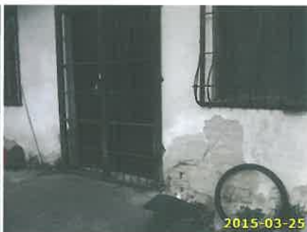
A felépítmények és állapotuk