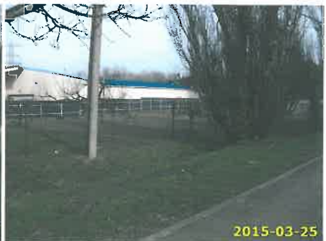
Az ingatlanok környezete, megközelítése